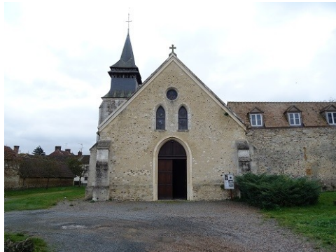
Église de Clef Vallée d'Eure

Les avis seront cohérents avec ceux émis ces dernières années, à savoir : pas de maisons à volume compliqué (type V, W, Y, ou Z), pentes à 45° pour les volumes principaux, ardoise ou tuile plate de teinte brun vieilli, à 20u/m 2 , avec un débord de toiture de 20cm, enduit de teinte beige clair avec modénatures (au choix : chaînages, encadrement de fenêtres, soubassement, colombage...). *Voir les autres fiches.