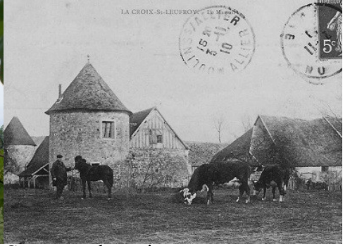
Carte postale ancienne

Pour la zone en rose foncé dans le périmètre de 500m